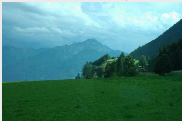
Na ulasku u Mallnitz

Završavamo obilazak Graza. Preko Villacha, Spitala i Obervellacha dolazimo u Mallnitz.