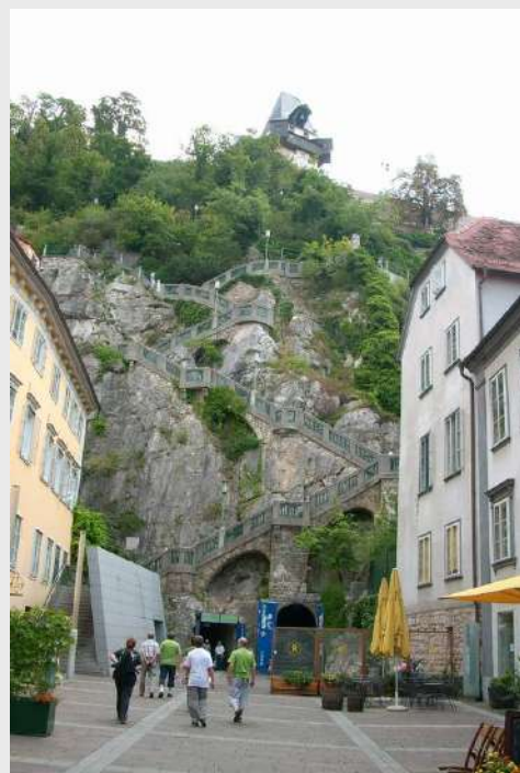
Od trga Schlossbergplatz stepenicama na Schlossberg

Nakon razgledanja Dvorca idemo do centru grada, prelazimo preko mostića na Muri dolazimo do trga «Schlossberg, prekrasan pogled na stepenice koje nas vode na Schlossberg gde se nalazi najstarija zgrada grada iz 13. veka. Obilazak počinje kod tornja sa zvonom, sagradjenim 1588. godine u kojem se nalazi najpoznatije zvono Graza pod imenom «Liesl». Zvono ne nalaze na najvišem spratu, ukupna težina mu je 4632 kg, zvoni tri puta dnevno sa 101. otkucajem.