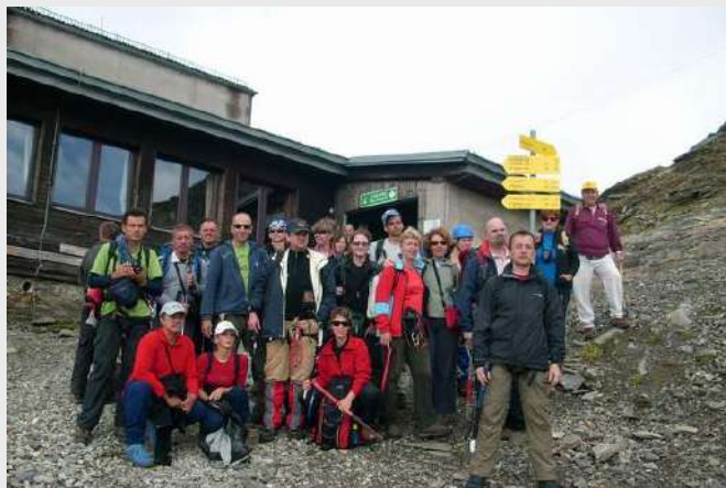
Grupa ispod Hannoverhausa

Grupa od 19 planinara markiranom stazom broj 520 polazi ka vrhu Ankogel, vreme je oblačno ali nam to ne smeta. Spuštamo se krivudavom stazicom na 2580m a zatim lagano penjemo, prelazimo preko kamenih ploča, lednika ispod nas dolina Mallnitztza a iznad nas Ankogel u magli.