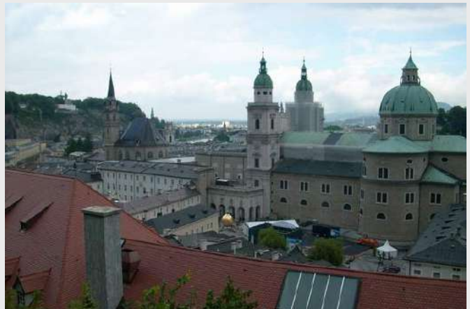
Pogled na Katedralu

Vreme je za polazak. Prolazimo kroz predivni brdske predele, kuće u planinskom stilu ukrašene ledenim