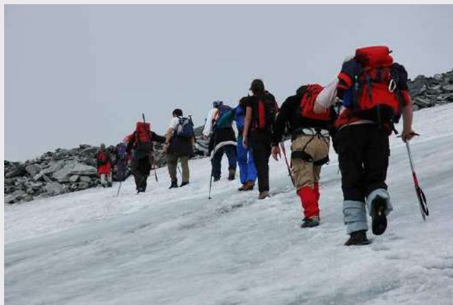
Preko lednika >