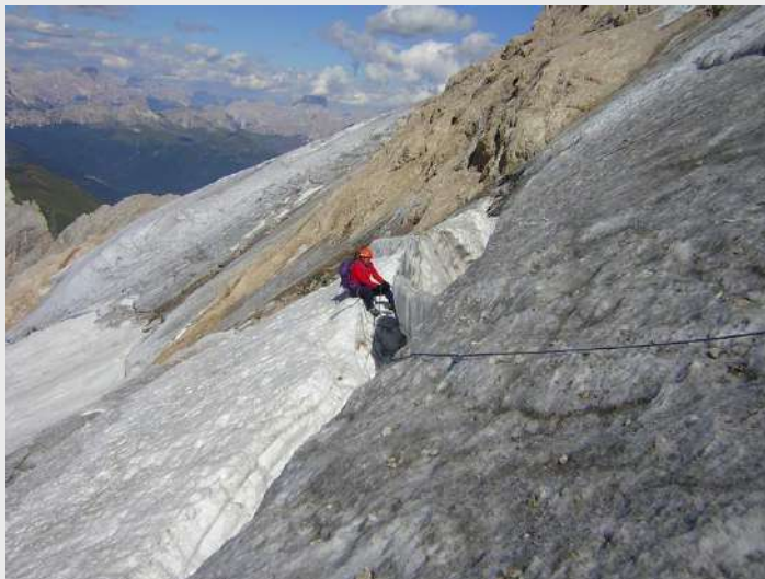
Borko u akciji spasavanja

Pogledao sam na sat kako bih kada (i ako) izađem iz pukotine znao koliko sam proveo pod zemljom - sada je 15.31. Čekajući na Borka pokušavao sam nekako da se derezama dokopam jedne izbočine, oslonim se na sopstvene noge i time izbegnem neprijatan osećaj višenja na užetu. Nije bilo moguće. Onda sam našao pogodan položaj tako da što više zaštitim telo od hladnog viševjekovnog leda od koga su prsti već počeli da mi trnu.