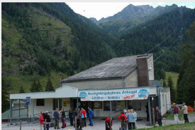
Žičara u podnožju

Ustajanje, doručak i priprema za polazak. Cela grupa autobusom polazi do žičare. Prvi polazak žičare je u 8.30, kupujemo povratnu kartu do Hannoverhausa (2626 m). Fotografišemo se, grupa se deli na dva dela.