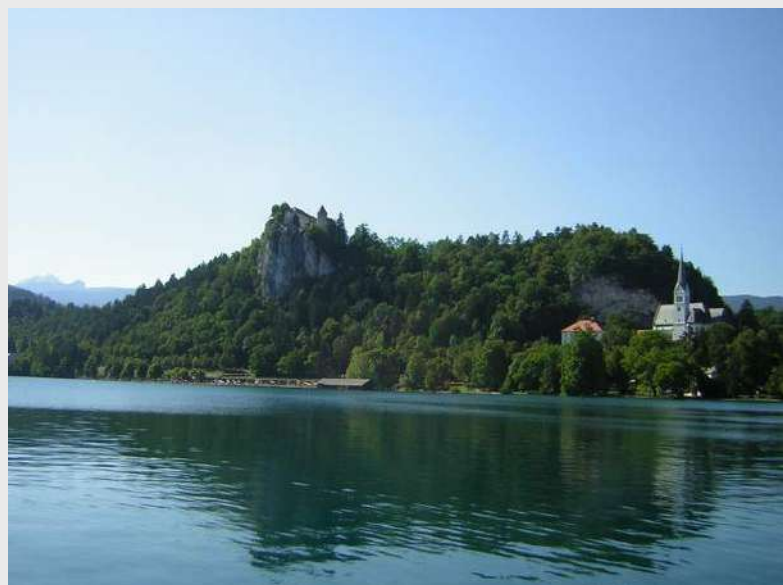
Bledsko jezero i grad Bled

U 18h polazimo ka Ljubljani, čeka nas Vlasta, smeštamo se u Cankarijevom domu.