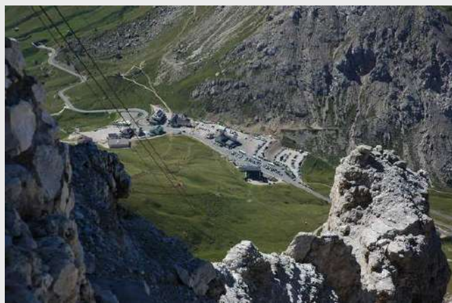
Pogled na Passo Pordoi

Odavde smo otišli preko sipara na prelaz, a onda prema vrhu Piz Boe (3125m). Piz Boe je najviši vrh grupe Sella odakle se pruža divan pogled na planine u okolini. Na vrhu grupa je ostala oko sat vremena za to vreme pratili su dvogledom kako se I grupa penje na Marmoladu.