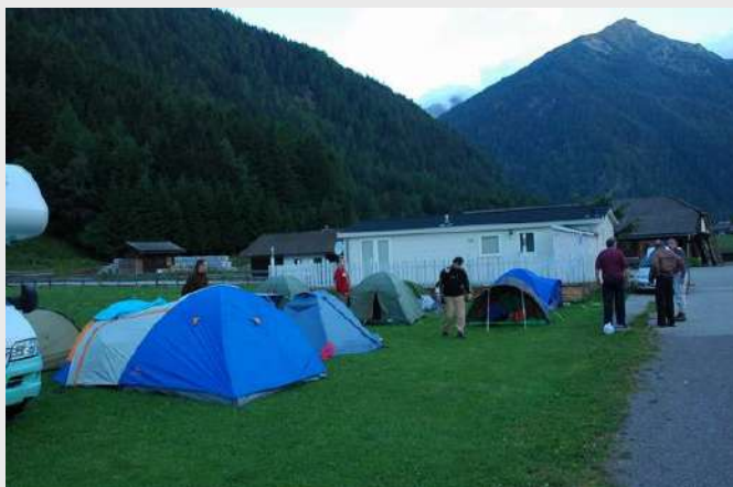
Kamp u Mallnitzu

Kamp kod Helmuta: zelena livada, pristojni WC-i, tuševi sa toplom vodom - ukoliko ubacite žeton koji košta 1 EUR imaćete 7 minuta toplu vodu.