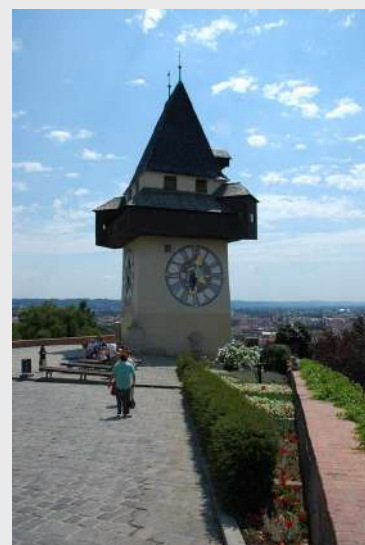
Toranj sa satom

Završavamo obilazak Graza. Preko Villacha, Spitala i Obervellacha dolazimo u Mallnitz.