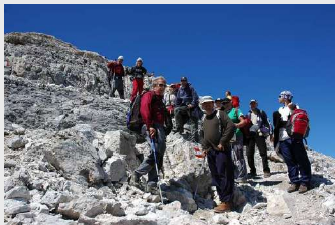
Polazak ka Arabbi

Ponovo smo svi zajedno na jednom mestu. Čestitamo jedni drugima na uspehu i srećno završenim usponima. Odmaramo se još pola sata i polazimo ka kampu Malga Capella. Dolazimo u kamp, srećni što se ovaj dan završio bez loših posledica, širimo šatore za noćenje. Ingrid i prijatelji se vraćaju za Sloveniju.