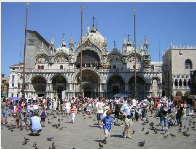
Katedrala Svetog Marka

Venecija ima mnogo poznatih gradjevinskih i umetničkih spomenika: Dužbeva palata, crkva Svetog Marka i devedeset drugih crkava, bogati muzeji, umetničke galerije, akademija umetnosti (Accademia di Belle Arti),