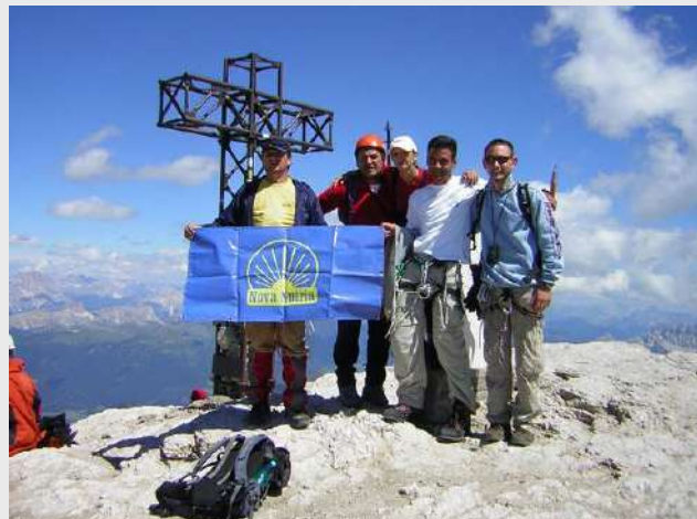
Druga naveza, sat vremena kasnije

U blizini je bivak Bianco, svraćamo za pečat i da se okrepimo a zatim krećemo sa vrha istom stazom. Dereze na noge lagano se spuštamo, naša druga naveza ide nam u susret. Ponovo skidamo dereze, čekaju nas sajle,