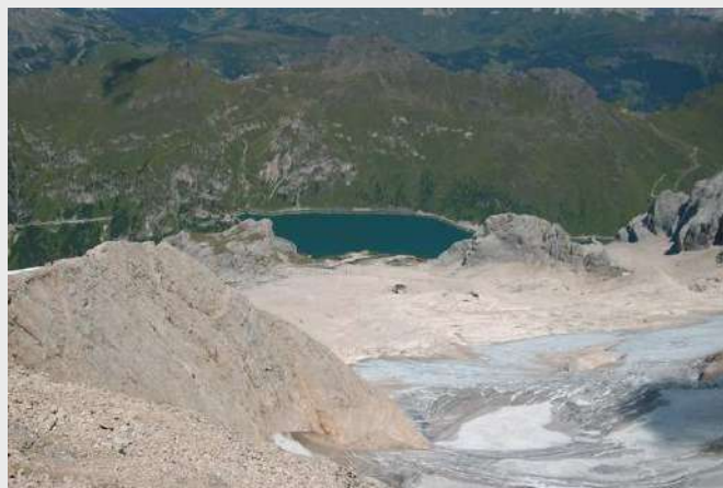
Pogled na jezero Fedai sa Marmolade

Oko 6 h, čujem neko ulazi, domaćini, pomislih biće problema. Na naše iznenadjenje gospodja izlazi ostavlja nas da i dalje spavamo. I ostali se bude uz šalu - smeštaj bio fantastičan, bilo bi dobro da i sleduću noć spavamo na istom mestu da ne širimo šatore.