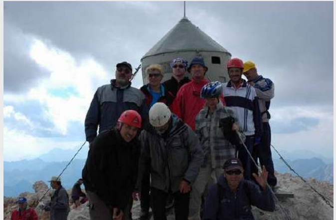
... i ispenjava ga