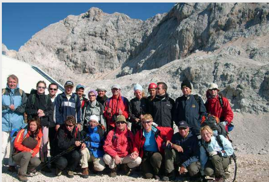
Priprema za polazak nazad u dolinu...

Spuštamo se polako do doma. U domu gužva kao i obično vareme je za odmor, analiziramo protekli dan a zatim svi na spavanje.