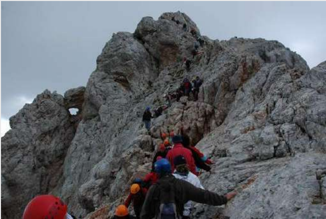
Prva grupa napreduje ka Triglavu...