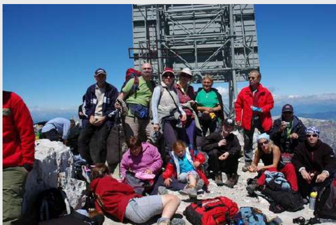
Drugi deo grupe na Piz Boe

Spustili smo se na drugu stranu do Arrabe, a zatim došli do jezera Fedai.