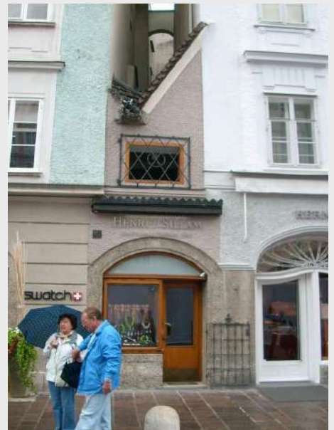
Najmanja kuća na svetu

Dolazimo u Salzburg, Mocartov grad, prelazimo preko reke Saltz obilazimo: Katedralu, barokne fontane, Mocart platz, Mocartovu rodnu kuću, najmanju kuću na svetu, tvrđavu Hohensalzburg i park Mirabell.