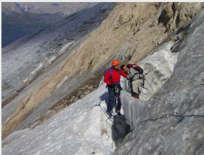
Konačno na površini!

Plan deluje lako, samo je malo problem što večni led ne dozvoljava cepinu prodor više od par milimetara, a uska pukotina ne dozvoljava veći zamah cepinom. Tako da cepin nije uspevao da drži više od 30% moje težine, dereze u početku zbog nezgodnog položaja nisam uspevao nikako da upotrebim tako da je ostatak moje težine izvlačio Borko.