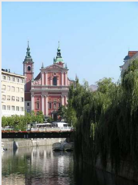
Ljubljana leži na reci Ljubljanici

Nastavljamo put do Bleda, pravimo pauzu od 3h. Po izboru slobodno vreme za kupanje, razgledanje ili odlazak u restoran na čuvene krempite.