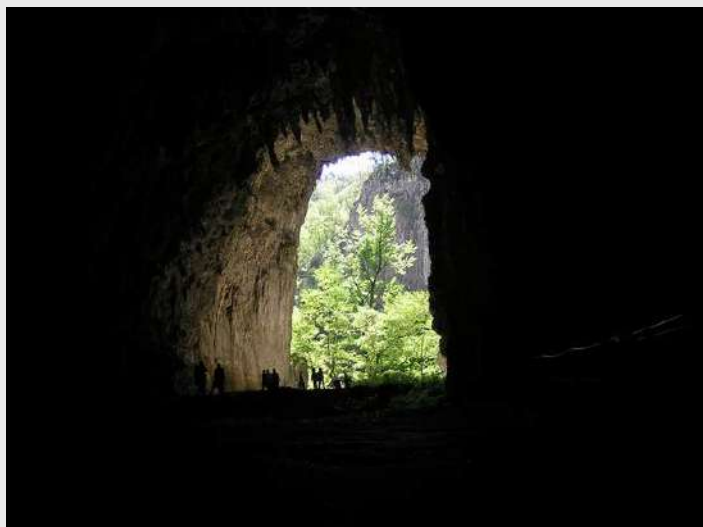
Izlaz iz Škocijanske jame

Prolazimo kroz lavirint Paradiž do Velike dvorane, na čijem dnu su ORJAK stalagniti visoki i do 15m. Malo dalje su čuvene ORGULJE. Ovde se prvi put čuje žubor reke REKE, koja prolazi kroz Šumeću Jamu, jama je dugačka 3,5 km, široka od 10 do 60m a visoka preko 100 m. Na izlasku iz Tihе jame, pogled na kanjon REKE zaista je impresivan. Put nastavljamo po galeriji, put je uklesan kroz stenu do Cerkvnikovog mosta, most je postavljen 45m iznad ulaza reke REKE u Hankejev kanal. Kroz nekoliko dvorana polako spuštamo do najniže tačke, 144 m ispod površine zemlje, da bi se ponovo popeli putem do najlepših ukrasa. U jami su pronađene kosti jamkog čovjeka i puno arheoloških ostataka. Na samom izlasku iz jame nalazi se vodopad visine preko 10 m.