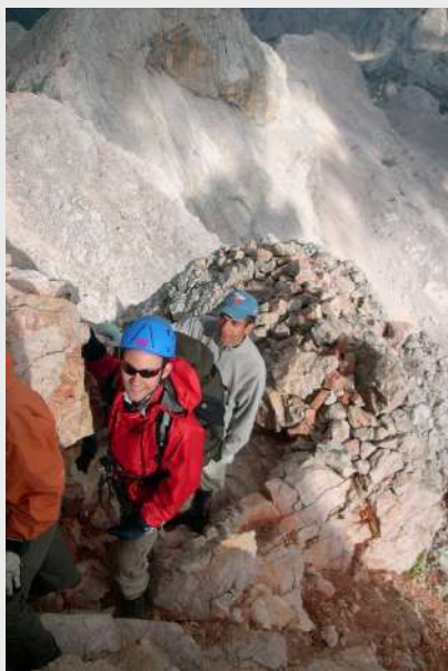
Pristiže i jača grupa

Slabija grupa stiže u planinarski dom Planiku, ostavljamo stvari u domu i krećemo uz sajle ka malom Triglav a zatim na veliki Triglav. Oko 16h grupa stiže na Aljažev stol, čestitamo jedni drugima, fotografišemo se. Samo što smo krenuli sa vrha druga grupa sa Darkom ide nam u susret.