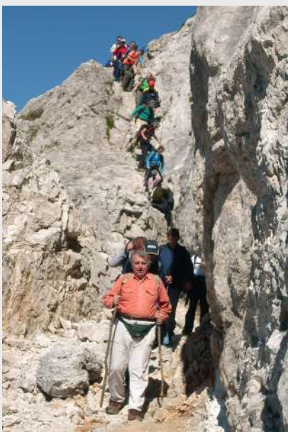
Povratak ka Rudnom polju...