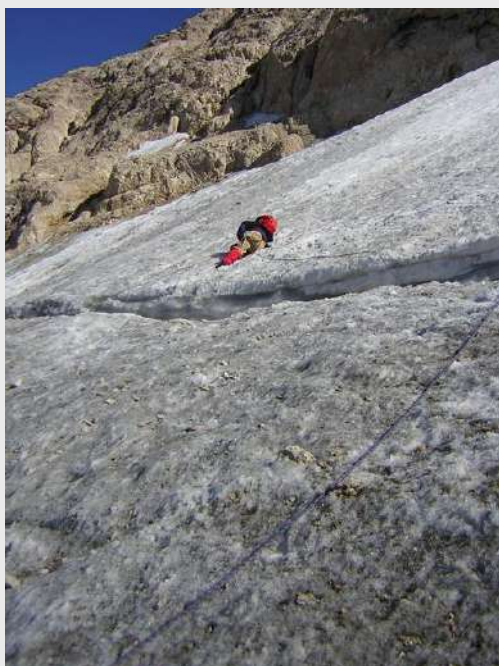
Zoran je ukočio na vreme ispred prve pukotine! Ja se nalazim u drugoj, njoj paralelnoj

Ispod mene je dno pukotine, možda samo pola metra od mojih stopala. Psihički je dobro da znam da u gorjoj poziciji ne mogu da budem, tj. da ispod mene ne zjapi beskrajni ponor, a opet je šteta što visim i istovremeno osećam bol usecanja pojasa - kad je dno već tako blizu. Iako se meni čini pliće i otvor pukotine bliži, na dubini sam od 10 metara (to smo ustanovili kasnije na osnovu dužine užeta).