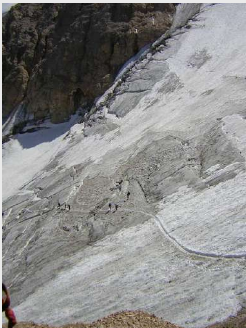
Pogled na glečer izbrazdan pukotinama

.....Spuštamo se sa vrha Marmolade, naša naveza je u kašnjenju za prvom navezom sat vremena. Stenoviti deo oprezno i relativno brzo otpenjavamo i stižemo na početak glečera. Velika je gužva. Nekoliko stranih naveza stavlja dereze i priprema se da otpočne spuštanje preko glečera a mi kao poslednji čekamo da se raščisti gužva. Konačno posle 45min su sve naveze na glečeru, pa ubrzo i mi krećemo. Borko je kao vodja naveze u silasku poslednji, a mene je odredio kao prvog.