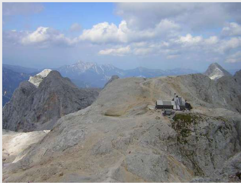
Pogled na dom Kredaric

Dok se penjemo uz Triglav vidimo kolone planinara kako idu ka vrhu, kao na magistrali. Sa Kredarice se čuje muzika, slavi se 80. godina od postavljanja makete Aljažev sto na vrhu Triglava.