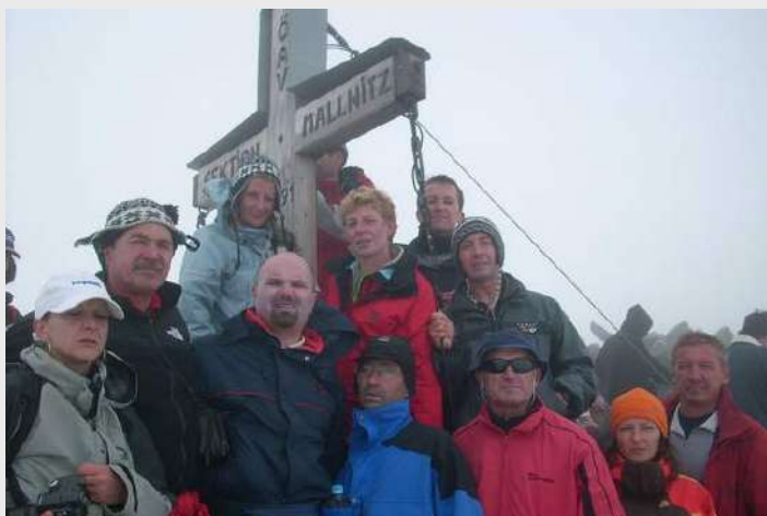
Na vrhu Ankogel 3252m

Počinje da duva jači vetar, hladno je, imam utisak da će svakog trena početi da pada sneg. Pravimo pauzu kod prirodnog zaklona na 3097 m n/v. Jedan planinar odustaje, idemo dalje uz greben i strminu. Sva sreća, ne pada kiša, inače bi se po blatu veoma teško kretali. Magla je prekrila vrh, vidljivost slaba, fotografišemo se i radujemo što smo popeli Ankogel (3252 m).