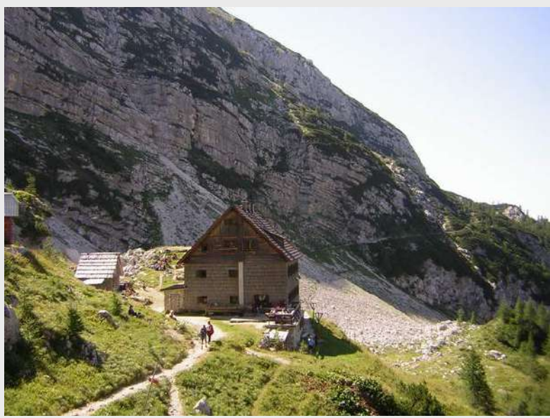
... preko Vodnikove koč

Nastavljamo put do Bleda, pravimo pauzu od 3h. Po izboru slobodno vreme za kupanje, razgledanje ili odlazak u restoran na čuvene krempite.