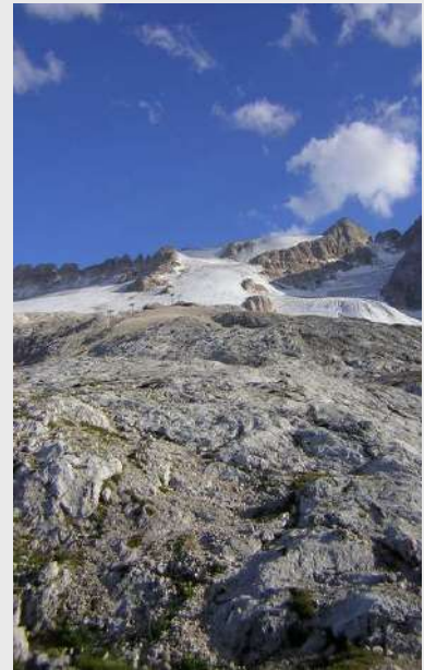
Poslednji pogled na Marmoladu

Čekamo drugu navezu i grupu da se vrati sa Piz Bue. Zadnja žičara je odavno sišla, vreme odmiče, ne pojaljuje se ni jedna ni druga grupa. Oči su nam uperene u pravac odakle bi trebala da dodje druga naveza. Vidimo drugu navezu kako silazi niz planinu. Čekamo ih da se našalimo sa njima i da im čestitamo na uspehu. Približavaju nam se, ne vidimo radost u njima, već na pitanje 'gde ste?' odgovaraju da je Nenad upao u glečersku pukotinu, ali na svu sreću Zoran je dobro osigurao Nenada. Zatim je Borko osigurao ostale i Nenadu pomogao da izadje iz pukotine bez posledica. Kako je Nenad upao u glečer možete videti iz izveštaja koji je Nenad napisao, u nastavku.