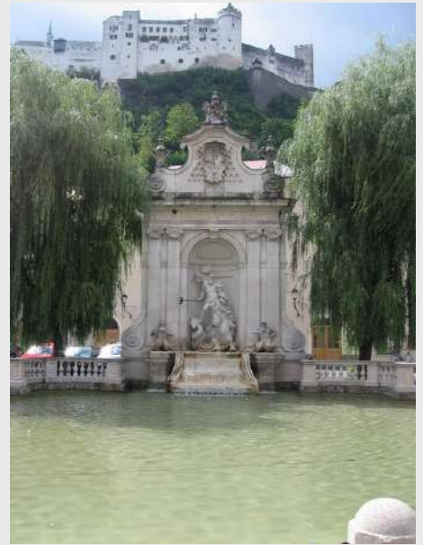
Fontana, a iznad nje tvrđava Hohensalzburg

Salzburg je austrijski grad koji se nalazi uz reku Salzach, okružen je planinama a izgrađen je u baroknom stilu. Sa svojim alpskom okruženjem i tradicionalnim centrom 1997. godine je proglašen UNESCO baštinom Salzburg je prelep grad opisan u Zvuku muzike. Tradicija grada je bogata i duga, proteže se još od rimskih vremena, ali je tek u 16. veku, zahvaljujući velikoj viziji i snazi volje princa nadbiskupa Wolfa Dietricha von Raitenaua, Salzburg postao grad kakav poznajemo danas. Ulice grada su popločane kamenom, povezane su uskim prolazima koji vode na elegantne, zaklonjene trgove a na svakom koraku možete naići na prekrasne primere arhitekture. Wolfgang Amadeus Mozart, neuporedivi genije muzičke umetnosti, nesvakidašnja i jedinstvena pojava na Evropskom muzičkom nebu XVIII veka, rođen je u malom austrijskom gradu Salzburgu, 27 januara 1756 godine. Za svoj kratki životni vek, 36 godina, uspeo je da stvori čak 626 dela iz skoro svih muzičkih formi koje su tada postojale. Obzirom da je Salzburg rodno mjesto Wolfganga Amadeusa Mozarta, ne čudi da je muzički život u Salzburgu izuzetno bogat. Salzburg Festival se smatra jednim od najvažnijih muzičkih festivala na svetu, a u gradu se održava i mnoštvo drugih festivala. Svake godine u Salzburgu se održava oko 4000 kulturnih događanja od kojih je većina muzičkih. Grad Salzburg je drugi po veličini u Austriji, glavni je grad istoimene pokrajine, u njemu živi 150.000 ljudi. Salzburg godišnje poseti preko 7 miliona posetilaca.