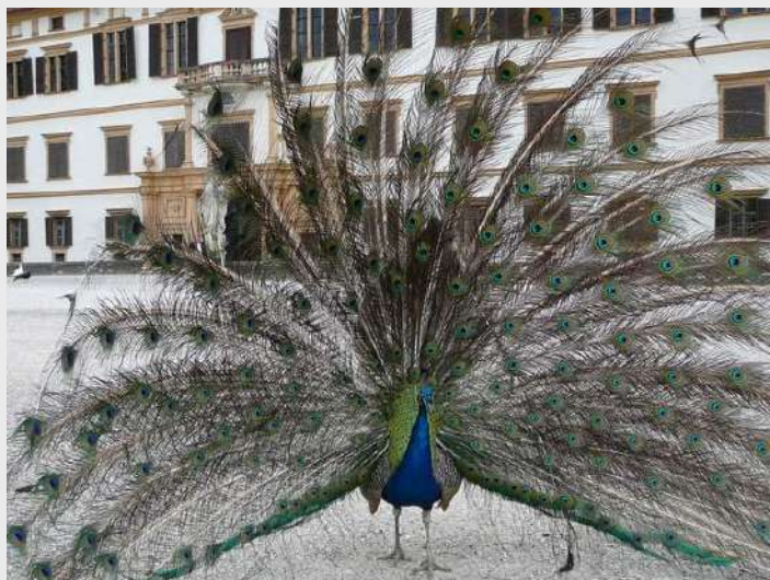
Paun ispred dvorca Eggenberg

Sagradio ga je Knez Johann Ulrich von Eggenberg 1623. godine. Dvorac se sastoji iz 4 tornja koja su simbol godišnja doba, 12 ulaza koji su simbol broj meseci u godini, 365 prozora simbol dana u godini. Unutrašnjost dvorca ogleda se u raskošnim dvoranama koje nažalost nismo mogli videti jer je dvorac bio zatvoren. Oko dvorca je romantično uređen vrt iz 19 veka pun zelenila.