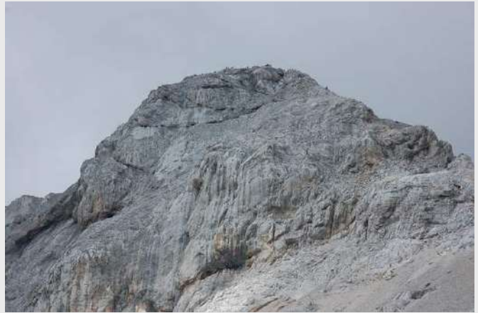
Pogled ka vrhu Triglava