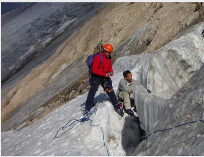
Odmor i oporavak na bezbednom