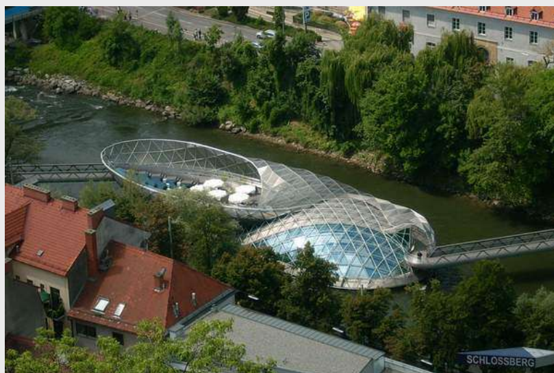
Ostrvo u obliku školjke na Muri sa kafanom i amfiteatom

Malo niže se nalazi tvrđava «Stallbastei». Tvrđava je opasana zidovima širine 6 m i visokim 20 m. U 16. veku služila je kao zatvor sa platformom za topove. Od 1715. godine na tvrđavi je postavljen alarm i četiri topa koji su služili kao signal da je negde nastao požar. Stižemo do tornja sa satom «Uhrturn», sagradjen je u 13 veku, veličina kazalji na brojčaniku je preko 5 m, na njemu se i danas može očitavati tačno vreme. Prelep pogled na Stari grad gde je smešten Mauzolej cara Ferdinada II iz XVI veka, Katedralu iz XIV veka koja služi kao crkva, Umetnički paviljon grada «Kunsthhaus». Na Muri u vodi je ostrvo «Murinsel», izgradjeno 2003. godine, to je plivajuća školjka, koja je povezana sa dva mostića sa obalama Mure. Na ostrvu se nalazi restoran i amfiteatar.