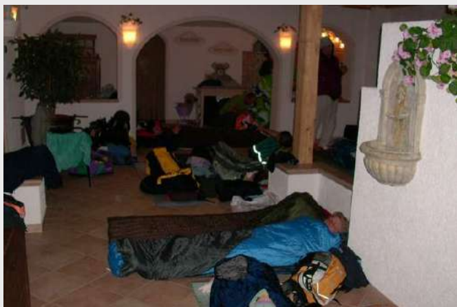
Malga Capela, spavamo ispred kupatila...

Oko 01 h stižemo u kamp Malga Capela gde imamo rezervisan smeštaj. Zajedno sa Vlastom tražim domaćine da se smestimo, kasno je, ceo kamp spava. Otvoreno a domaćina nema. Noć je hladna, ulazimo u veliku prostoriju kao dnevni boravak, toplu, blistavu od čistoće ukrašenu cvećem, čuje se lagana muzika,... pomislih da bi bilo dobro da se ovde smestimo da ne gubimo vreme. Pogledah malo bolje prostoriju, bilo je to predvorje za ulazak u kupatila. Smešno ali istinito, odlučismo - spavaćemo u predvorju sa vrećama i podmetačima. Grupa raspoložena za šalu, tuširanje, fotografisanje i ako je ponoć već podavno odmakla.