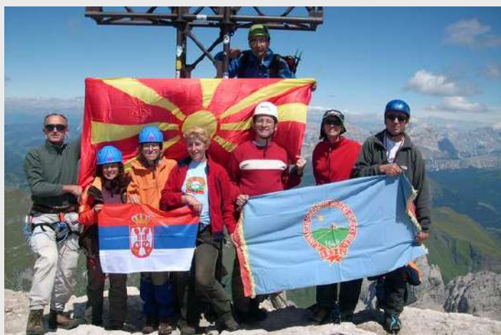
Marmolada 3343m i prva naveza

Ponovo izlazimo na sneg ostalo je oko 200 m n/v do vrha. Stavljamo ponovo dereze, lagano kećemo ka vrhu, oko nas vidimo prelepe vrhove, iza nas Piz Bue. Izlazimo na Marmoladu (3343m), na vrhu nema snega. Radujemo se, čestitamo jedni drugima na uspehu.