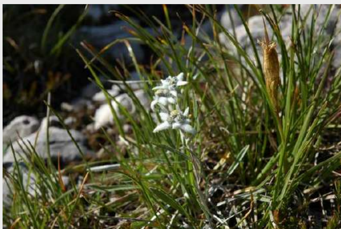
Elvelvaiz na Dolomitima